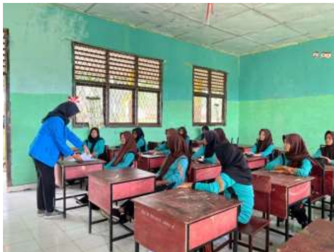
Gambar 2. Guru Mempersiapkan Media Visual yang akan digunakan

Berdasarkan hasil penelitian yang telah di dapatkan dari hasil analisis data penelitian tentang pengaruh media visual gambar terhadap peningkatan motivasi belajar siswa kelas VIII B terhadap mata pelajaran seni budaya. Pada pemba-hasan ini peneliti dapat memperoleh hasil yang terbilang sangat memuaskan. Karena pada kondisi awal sebelum dilakukannya metode pembelajaran menggunakan media gambar dan metode diskusi dapat terlihat masih rendahnya motivasi belajar siswa. Skor dari perolehan nilai yang didapat juga masih cukup rendah.