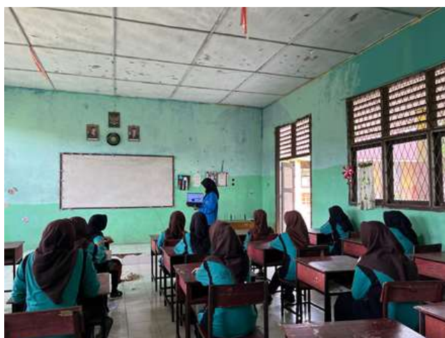
Gambar 3. Guru dan Siswa Ikut serta Dalam Menggunakan Media Visual gerak

Tetapi pada kondisi akhir dapat diliat peningkatan yang sangat baik setelah menggunakan media gambar dan metode diskusi.dari sini peneliti dapat melihat bahwa ternyata dalam proses belajar mengajar sangat penting untuk di perhatikan cara dan metode mengajar yang baik dan tepat, karena hal ini juga berkaitan dengan motivasi belajar siswa. Pendidikan yang baik tanpa cara dan metode yang kurang tepat memengaruhi ketertarikan dan daya tangkap siswa dalam memahami isi materi yang disampaikan. Oleh karena itu penelitian pengembangan dengan menggunakan media gambar ini sangat penting untuk diperhatikan. Bagaimana guru menyam-paikan materi yang baik dengan cara yang tepat agar siswa bisa memahami dengan lebih baik.dengan ini media gambar dapat di jadikan proses pengembangan pembelajaran kedepan nya lagi agar bisa menjadi suatu pembelajaran yang menyenangkan bagi siswa dan mempunyai isi materi yang dapat di terima dengan baik oleh siswa dan bisa menjadi peningkatan motivasi belajar siswa.